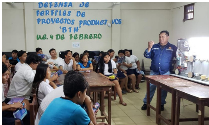
Socialización en Unidades Educativas, Trinidad - Beni