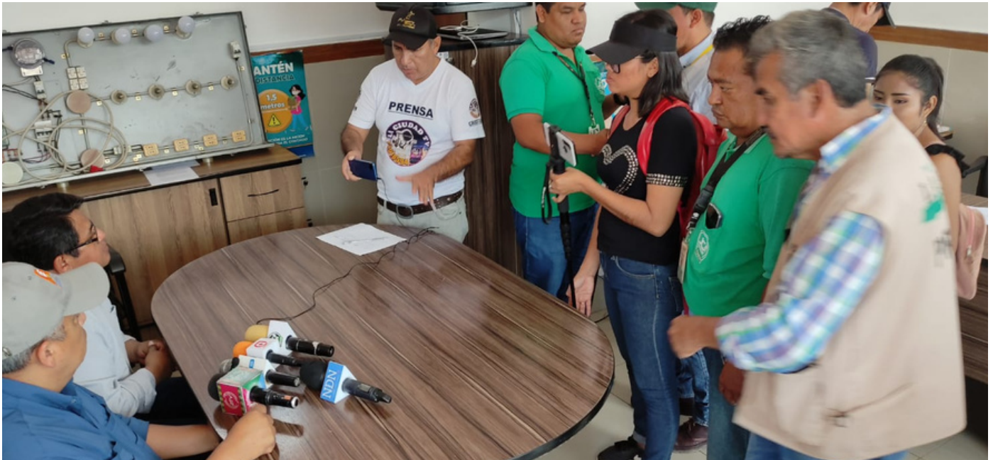
Conferencia de Prensa, Trinidad - Beni