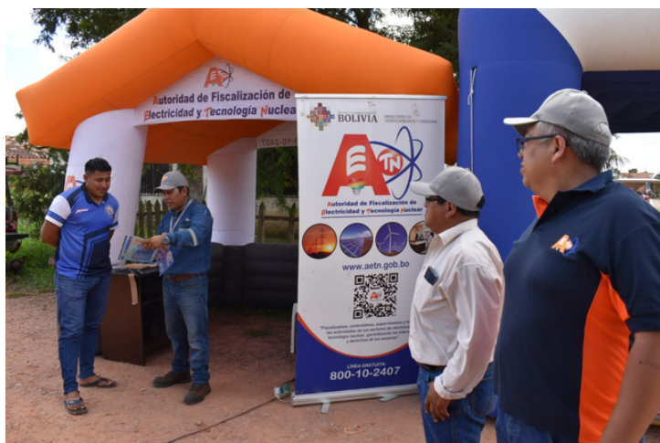
Difusión de Derechos del Consumidor, Trinidad - Beni