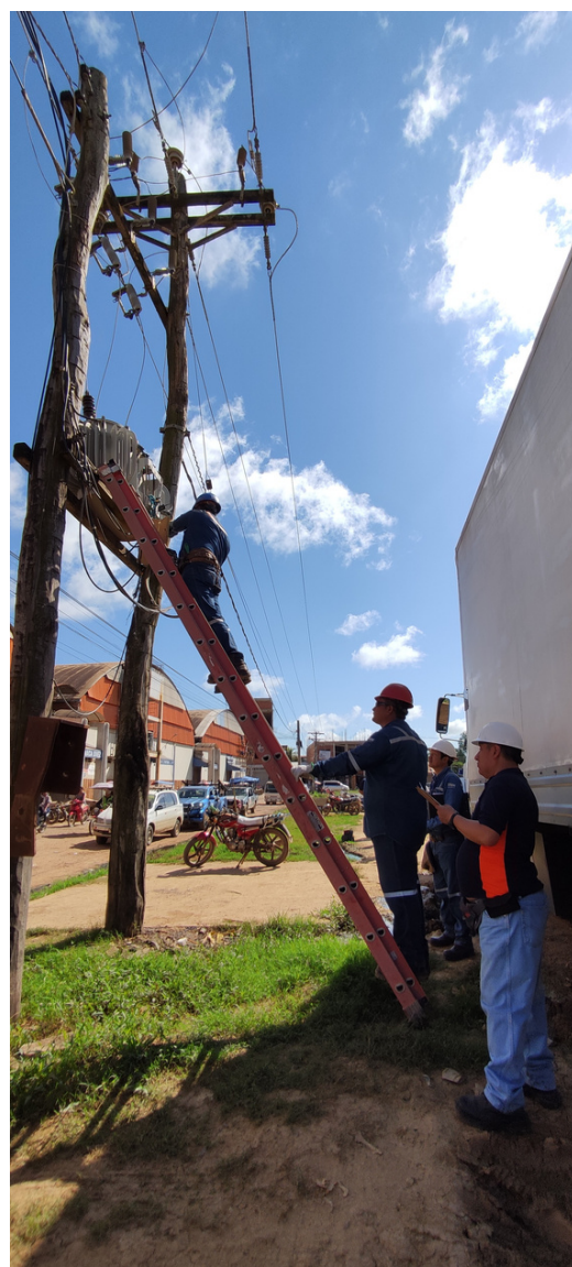
Supervisión en la instalación de Registradores