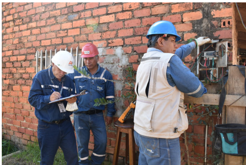
Verificación de medidores, Trinidad - Beni